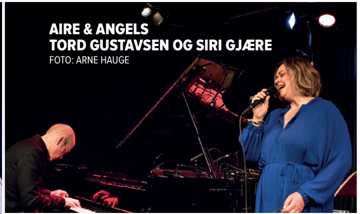
AIRE & ANGELS TORD GUSTAVSEN OG SIRI GJÆRE